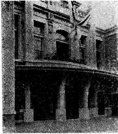
元近松座——これなれ改築して 新文樂座にたし。

ところが、今度文樂座と對抗して嘗て没落した四ッ橋々畔の近松座が、その外廓を殘して四橋ビルヂングになつてゐたのを、松竹で買收して、こゝに文樂座を再興するといふことです。お先はまつくらですが、人形芝居のために、根城はないよりもあるに越したことはありません。(註、この改築が竣成して昭和五年一月に開場す)この人形芝居